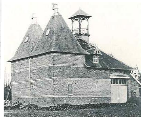
Krombeke (B) hopast naar Engels bestek, plm. 1900