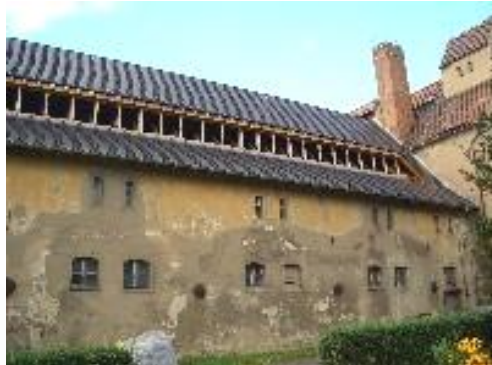
Görlitz, Saksen (Dld) 1861. Volledige restauratie van het landgoed 'Loensch's Gut' 2006-2008