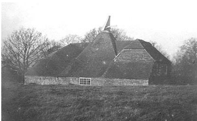
East Sussex (GB) oasthouse