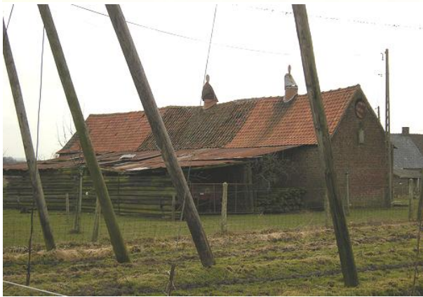
Poperinge (B) hoeve met hopast, beschermd sedert 2009