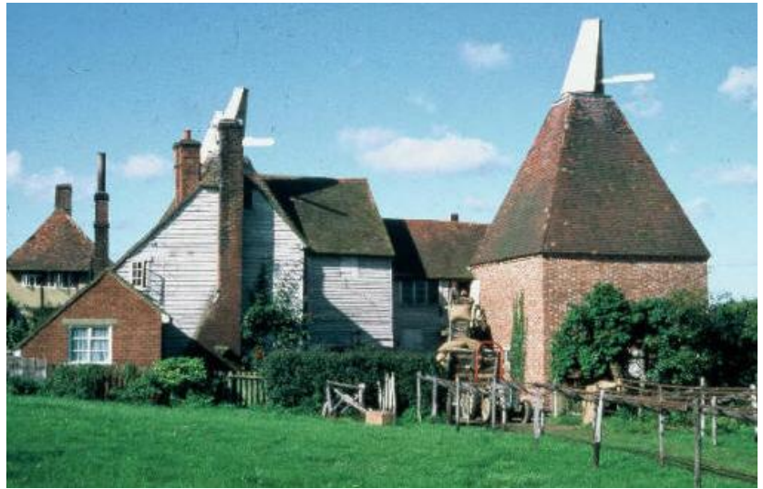
Catham, Kent (GB) 1814